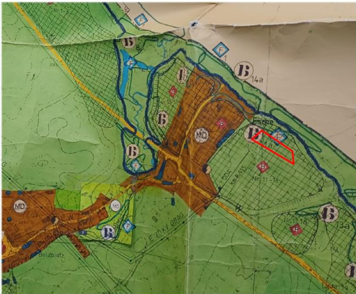
Flächennutzungsplan Gemeinde Stephansposching (nicht maßstäblich), Geltungsbereich (rot)