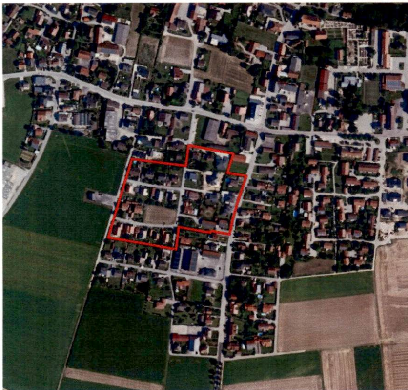
Abbildung 6: Luftbildausschnitt aus dem Bayern Atlas vom 16.07.2022 mit Kennzeichnung des Geltungsbereiches des Bebauungsplanes „Stephansposching“ – ohne Maßstab